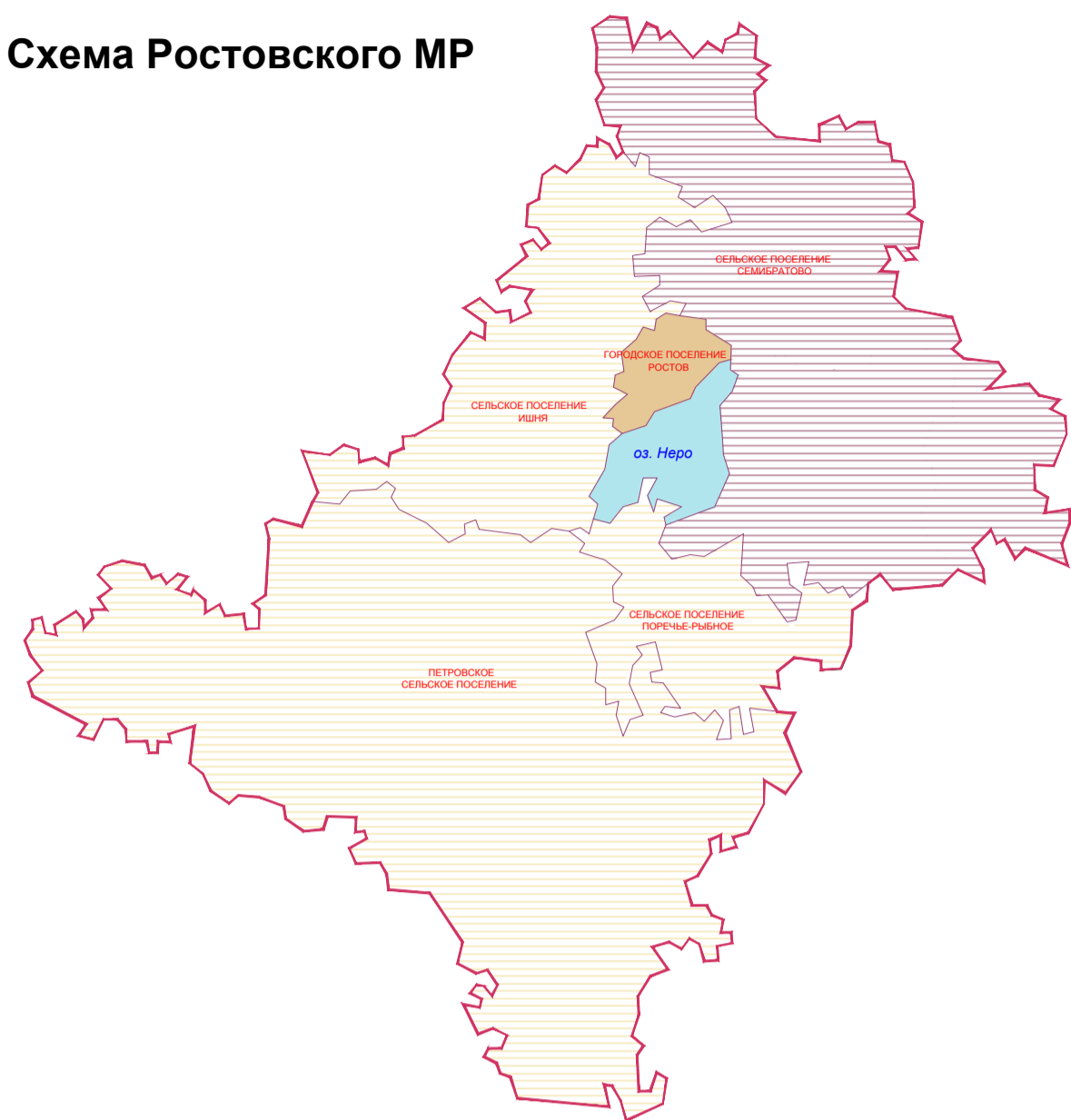
М 1: 5 000